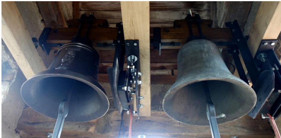
(Obr.: vlevo nový zvon sv. Josef, vpravo zvon sv. Václav z roku 1943)

Svůj příspěvek zakončím slovy, kterými končí slovní komentář na CD nosiči: „Zvony. Kolik slávy a neštěstí v dějinách ohlašovaly. Od nepaměti provázely lidské kroky, oznamovaly důležité události, upozorňovaly na nebezpečí, svolávaly k modlitbám. Zvuk zvonů v nás vzbuzuje dojetí, úctu, tichou radost, posvátnou bázeň. Ty údery kovu o kov, jako kdyby měly skutečné srdce, nejen to kovové. Promlouvají k nám denně. Měří náš čas od kolébky po hrob. Kéž hlahol trboušanských zvonů přináší z výšin stále zvěst pokoje, smíření a naděje do lidských srdcí.“ -vch-