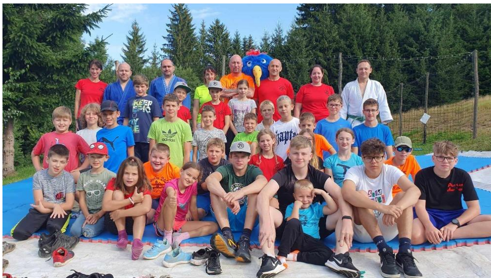
Obr.: Letní soustředění v Orlických horách, srpen 2023.

Všem dětem, které se zúčastnily závodů, děkujeme za reprezentaci oddílu. Chválíme všechny děti za snahu a píli na trénincích. Trenérům, rodičům dětí, obci Trboušany a všem, kdo se aktivně podílí na chodu našeho oddílu, děkujeme za podporu.