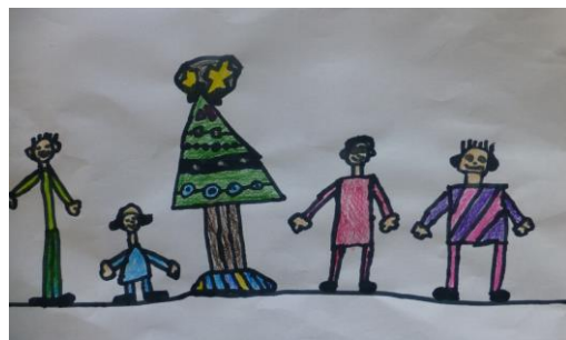
Obrázky nakreslili Zuzanka Zoufalá a Hozik Sattler.